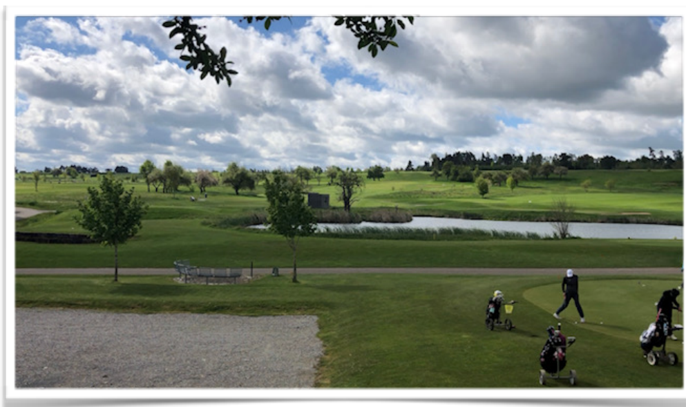
Bild: An diesem Hang laufen so gut wie alle Bahnen parallel entlang