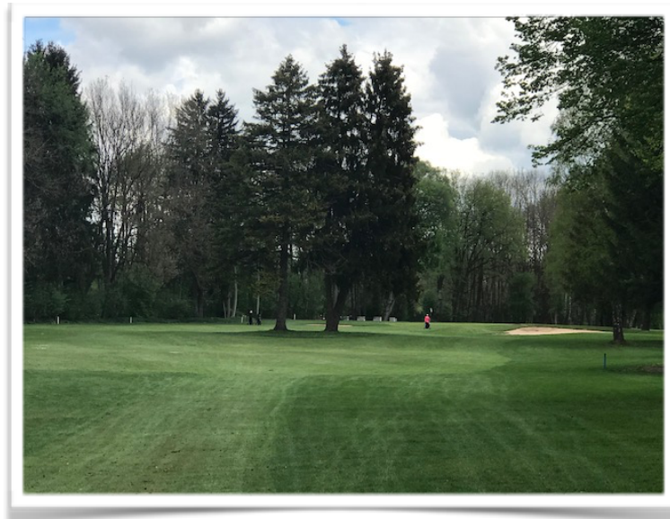
Bild: Bäume inmitten der Spielbahn erfordern spielerisches Können.